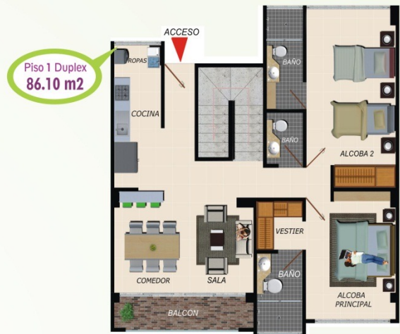
Piso 1 Duplex 86.10 m 2