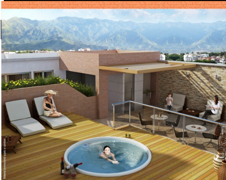
Material promocional sujeto a cambios