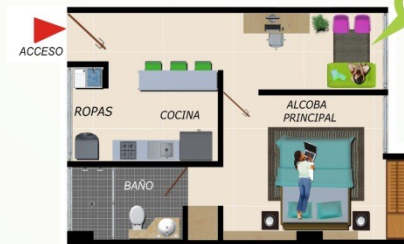
Apartaestudio 3 36.50 m 2