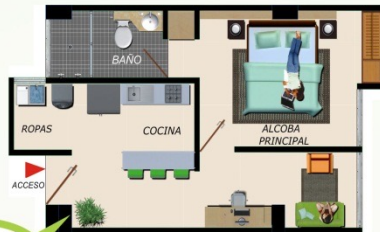
Apartaestudio 1 36.72 m 2