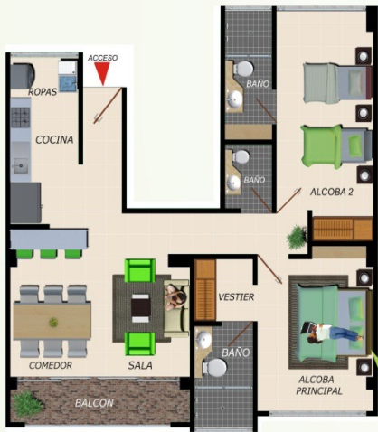
Apto. 2 Alcobas 77.50 m 2