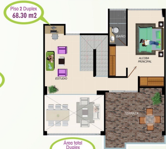
Piso 2 Duplex 68.30 m 2