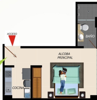
Apartaestudio 2 22.20 m 2