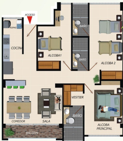
Apto. 3 Alcobas 88.00 m 2